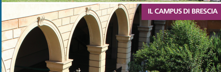
IL CAMPUS DI BRESCIA