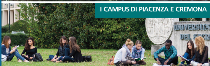
I CAMPUS DI PIACENZA E CREMONA