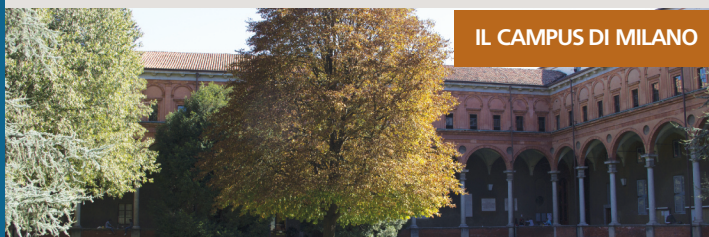
IL CAMPUS DI MILANO

Grazie a una tradizione ormai quasi centenaria, alla qualità del personale docente e non docente, allo stretto legame con il mondo imprenditoriale e istituzionale, ad una sempre maggiore attenzione alla dimensione internazionale, l'Università Cattolica offre ai propri studenti una solida preparazione culturale e una chiara proposta educativa che mira alla formazione integrale della persona.